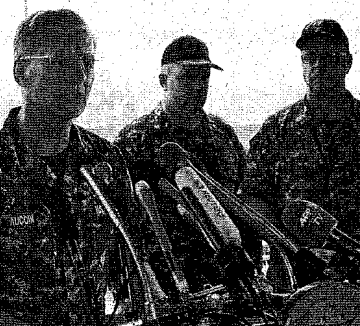
静岡県・伊豆半島沖で起きた米海軍のイージス駆逐艦「イージス」の乗組員が、不明者の捜索を終了した。艦内では数人の遺体が発見された。

【米イージス艦】駆逐艦内に数人の遺体... 駆逐艦「イージス」の乗組員が、不明者の捜索を終了した。艦内では数人の遺体が発見された。